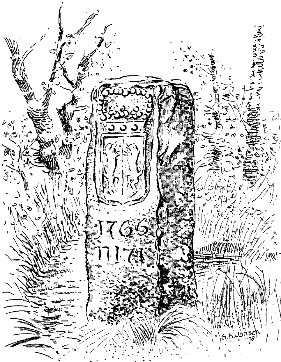
Tekening van G.H. Jansen. Wapenstein nr. 171 op "de Keesenbult" bij de oude grensovergang Bodendijk-Kruiskapel.