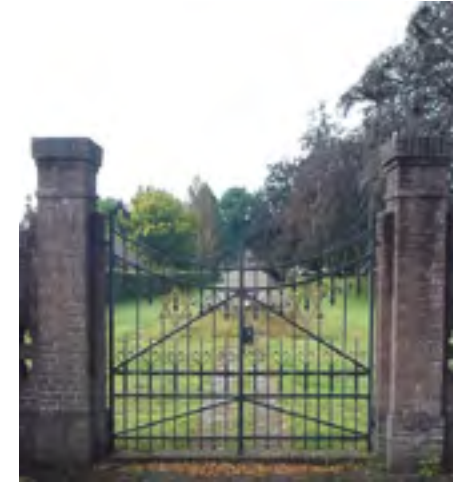
Begraafplaats Silvoldseweg 64 Terborg