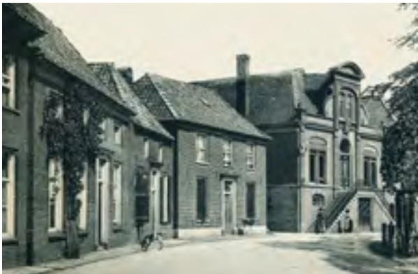
Het tweede huis van links was de huissjoel, foto Gerard Bruil

Sindsdien gingen de joden uit Varsseveld naar de synagoge in Terborg. De joodse families Gans, De Bruin en Levy woonden het langst in Varsseveld.