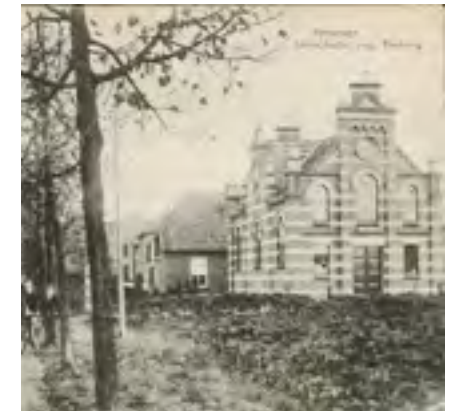
Synagoge Silvoldseweg 22

Een vrijwel exacte kopie van deze synagoge staat sinds 2018 in Mevo Horon in Israël, een initiatief van twee nakomelingen van Terborgse joden. De oorspronkelijke Terborgse thorarollen zijn, net als in 1901, met paard en wagen erheen gebracht.