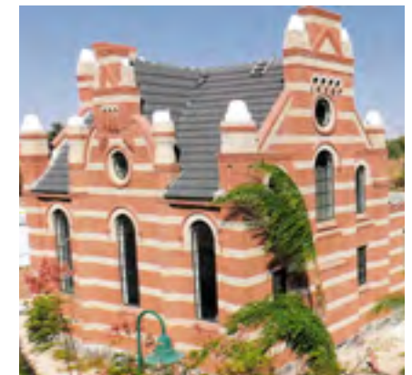
De Terborgse synagoge in Mevo Horon