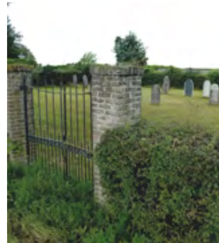
Begraafplaats Ulfseweg, naast nr. 37 Gendringen