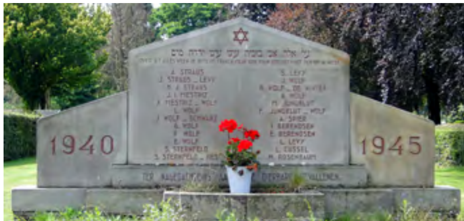
Op de joodse begraafplaats aan Silvoldeweg 64 in Terborg staat een monument ter nagedachtenis aan de joodse inwoners.