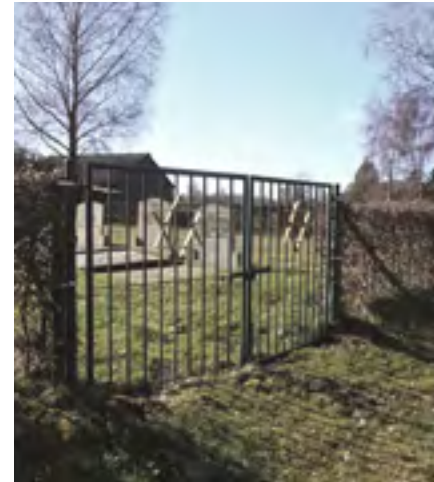
Begraafplaats Heelweg nabij Schippersweg 4