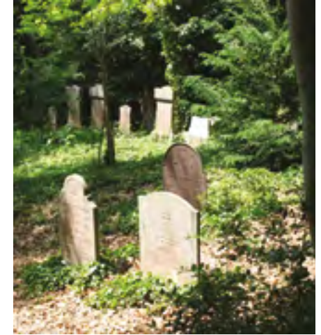
Jodenberg Silvoldseweg 17 Terborg Op afspraak te bezoeken