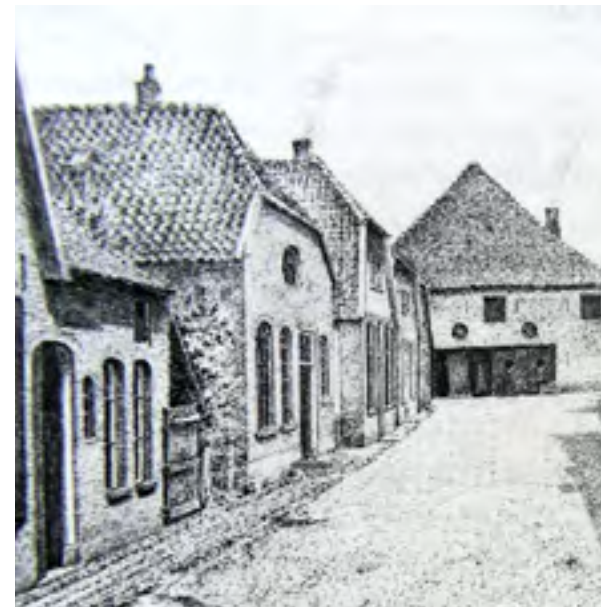
Kromme Elleboog in Gendringen, het tweede huis is de synagoge, tekening Hans Bresser

Op 8 maart 1945 verwoestte een bom het gebouw. Aan de weg van Ulft naar Gendringen ligt de oude joodse begraafplaats met 33 zerken.